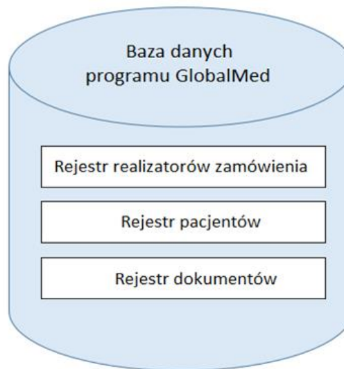
Rysunek 2. Struktura danych

Schemat struktury danych osobowych przechowywanych w bazach programu GlobalMed przedstawia Rysunek 2. Struktura danych.